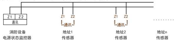
图二 一般环境推荐 采用双绞线 特殊环境推荐 采用屏蔽双绞线

注意：现场环境的相对湿度超出本说明书规定的范围时，请按虚线中的方式接入熔断器，防止电弧造成产品损坏。熔断器规格为1A。